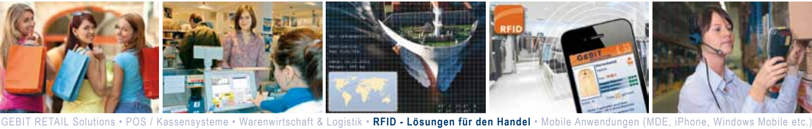
GEBIT RETAIL Solutions • POS / Kassensysteme • Warenwirtschaft & Logistik • RFID - Lösungen für den Handel • Mobile Anwendungen (MDE, iPhone, Windows Mobile etc.)