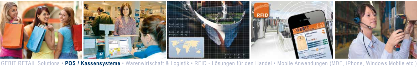
GEBIT RETAIL Solutions • POS / Kassensysteme • Warenwirtschaft & Logistik • RFID - Lösungen für den Handel • Mobile Anwendungen (MDE, iPhone, Windows Mobile etc.)