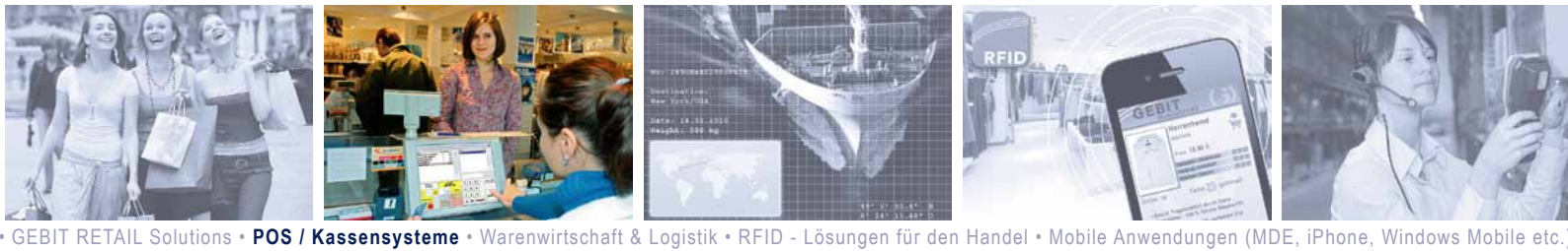
GEBIT RETAIL Solutions • POS / Kassensysteme • Warenwirtschaft & Logistik • RFID - Lösungen für den Handel • Mobile Anwendungen (MDE, iPhone, Windows Mobile etc.)

Die GEBIT POS-Plattform™ wird international beispielsweise in den Kassen der über 500 OBI-Baumärkte und den Kassen der europaweit über 1.000 dm-Drogeriemärkte genutzt.