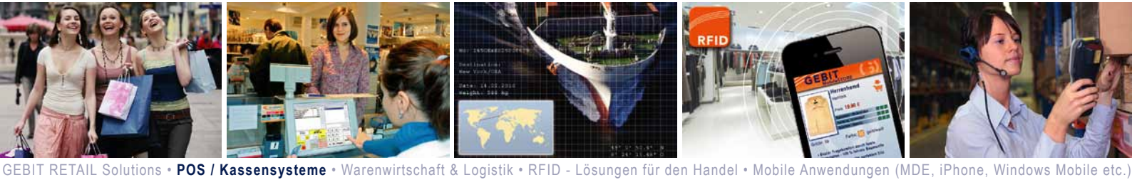
GEBIT RETAIL Solutions • POS / Kassensysteme • Warenwirtschaft & Logistik • RFID - Lösungen für den Handel • Mobile Anwendungen (MDE, iPhone, Windows Mobile etc.)